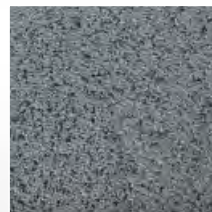
CETRIS® DEKOR 118 F