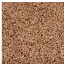
CETRIS® DEKOR 214 F