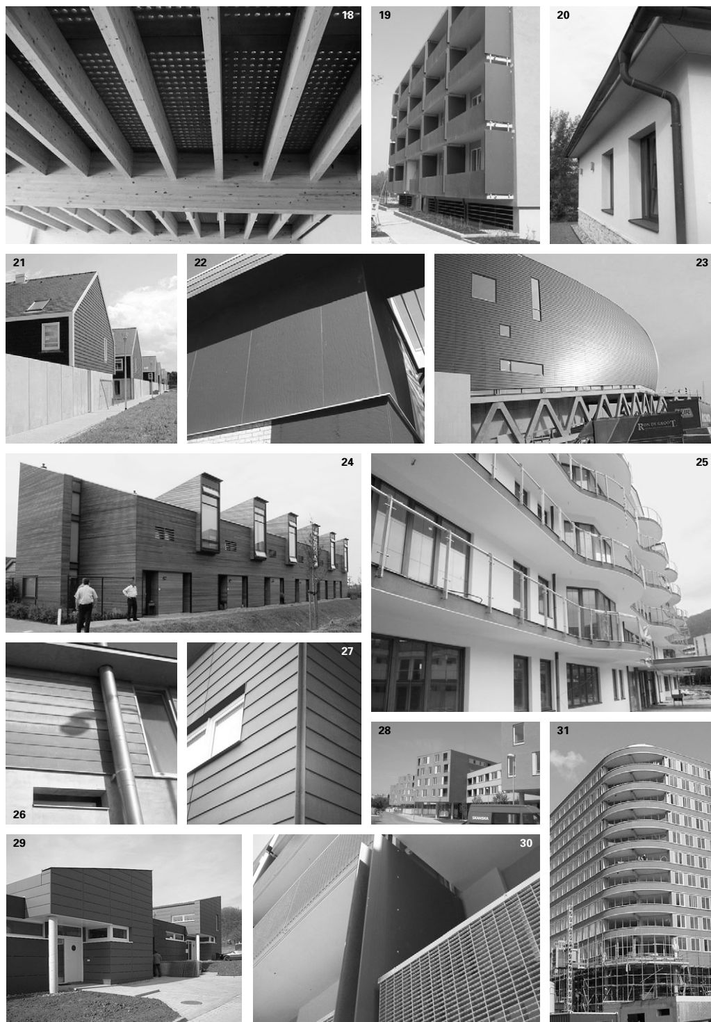
Obr. 1, 23, 33 Divadlo LUXOR, Rotterdam, Holandsko CETRIS® FINISH, fasádní opláštění, systém PLANK